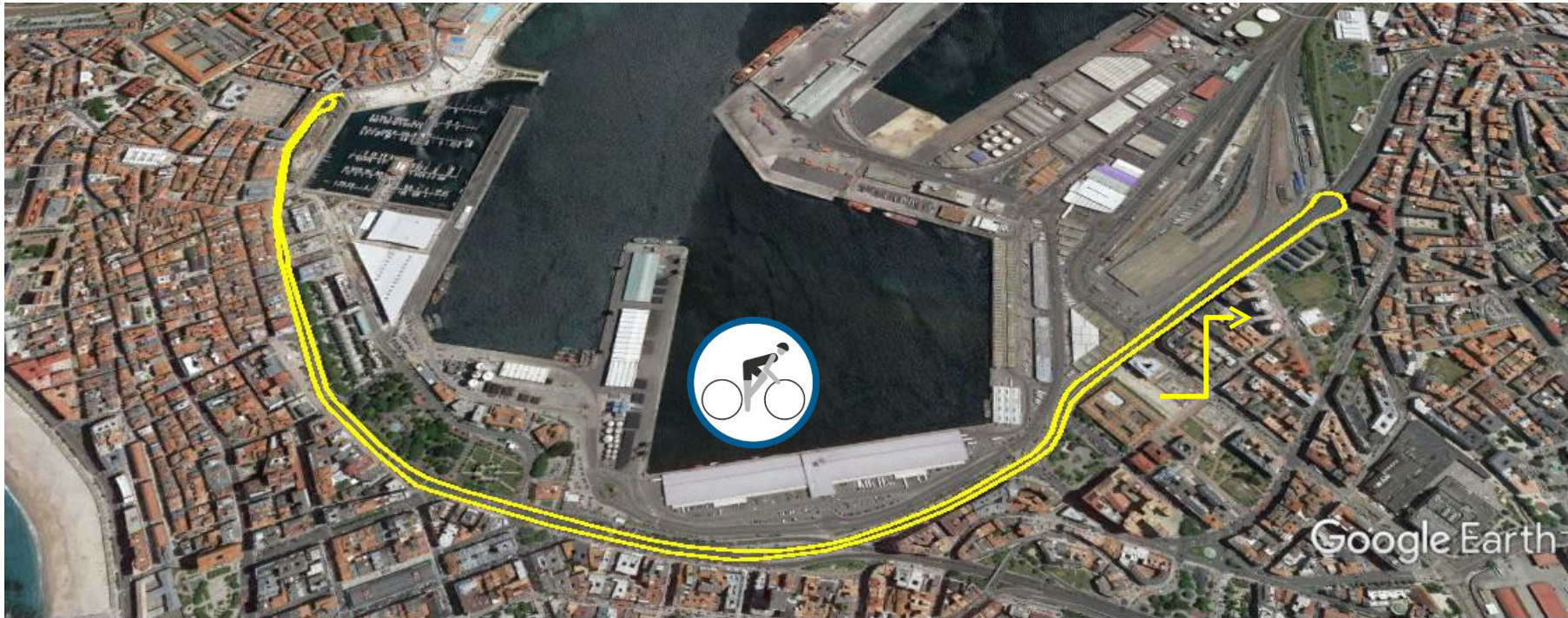
Gráfico: min., media, máx Elevación: 1,3, 9 m Total de intervalo: Distancia: 5,12 km Incremento/pérdida de elevación: 45,7 m, -45,6 m Pendiente máxima: 8,3%, -10,2% Pendiente media: 1,4%, -1,5%