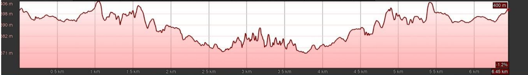
Gráfico: min., media, máx. Elevación: 371, 389, 406 m Total de intervalo: Distancia: 6.46 km Incremento/pérdida de elevación: 265 m, -265 m Pendiente máxima: 32.2%, -29.5% Pendiente media: 6.1%, -5.9%

1985 Fecha de las imágenes: 8/11/2018 43°00'48.40" N 7°34'53.78" O elev. 422 m alt. ojo 3.95 km