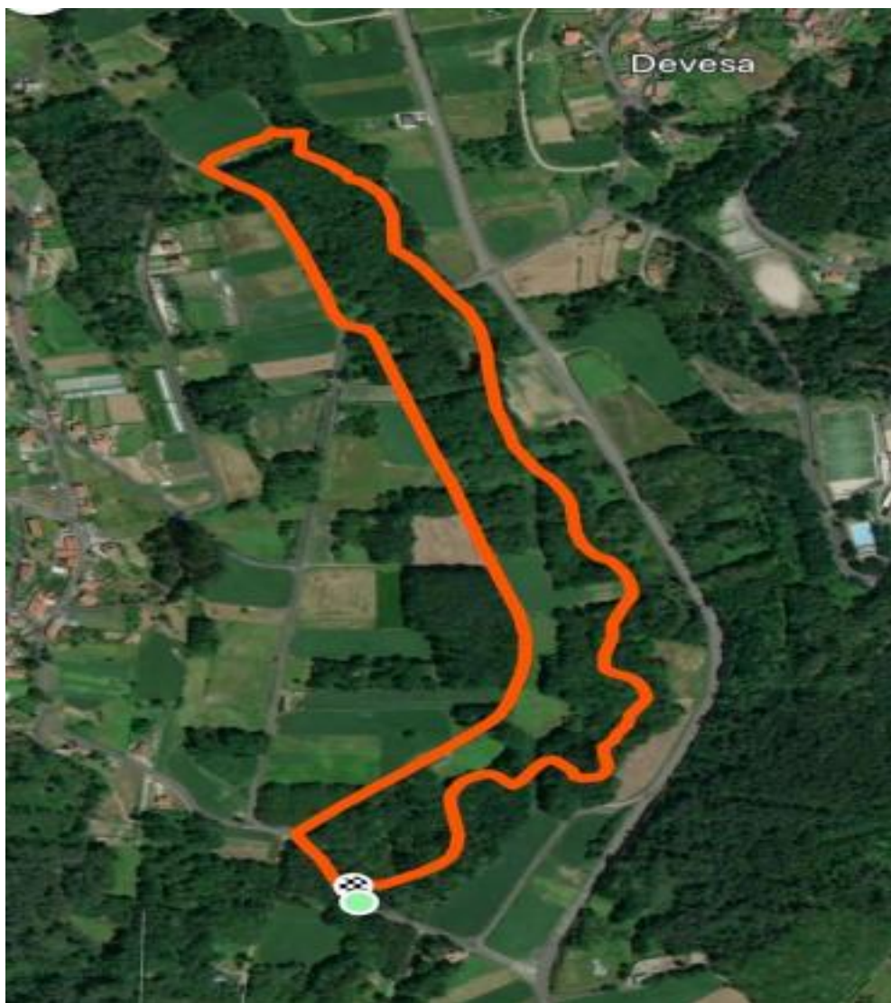
CIRCUITO CARREIRA DE BICI BTT