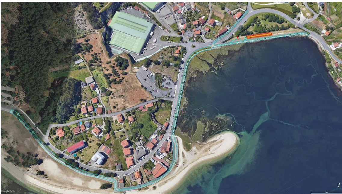
SECTOR 1 Y 3 CARRERA