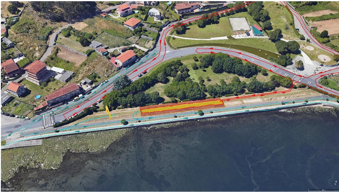
TRANSICIÓN E META