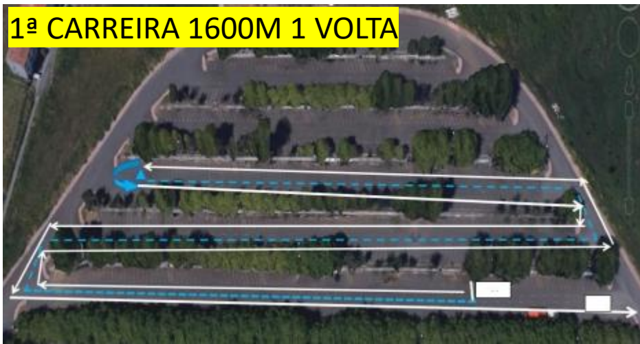
1ª CARREIRA 1600M 1 VOLTA