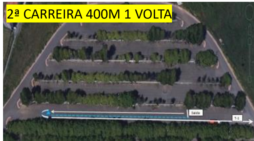
2ª CARREIRA 400M 1 VOLTA