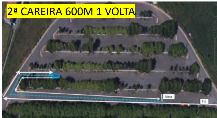
2ª CAREIRA 600M 1 VOLTA