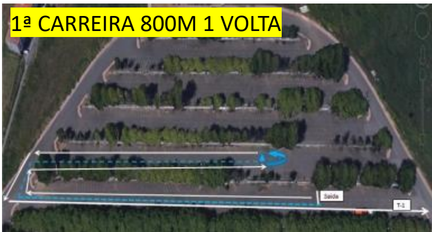
1ª CARREIRA 800M 1 VOLTA