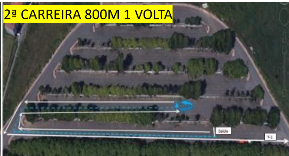
2ª CARREIRA 800M 1 VOLTA