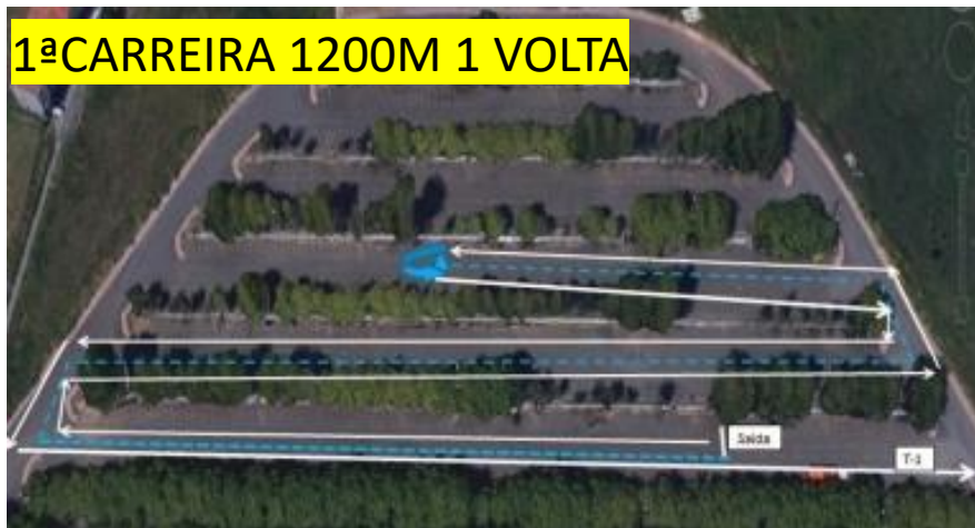
1ª CARREIRA 1200M 1 VOLTA