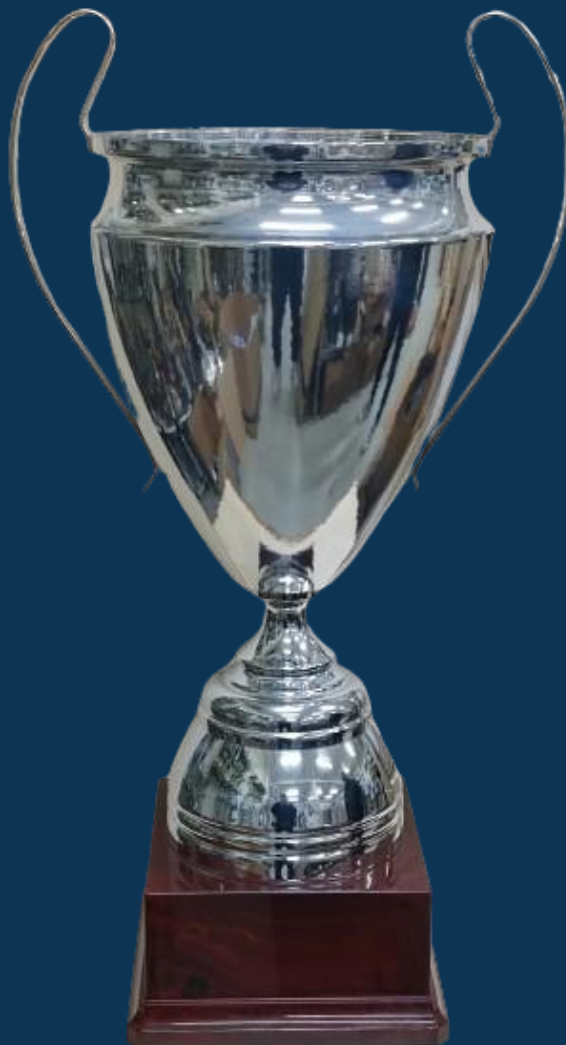
Ilustración 8: Trofeo Copa Galicia ao primeira persoa clasificada abosoluta en ambos xéneros