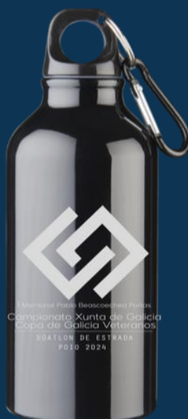
Ilustración 9: Regalo dunha botella de aluminio de 400 ml.

Deportistas que rematen a proba recibirán un agasallo conmemorativo.