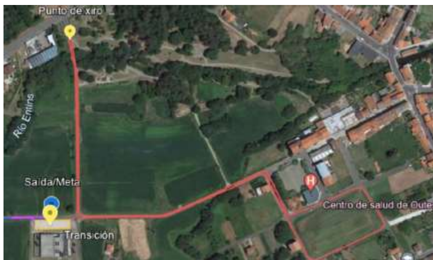
2ª Carreira a pe: 1 volta (200m)