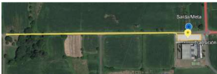
2ª Carreira a pé: 1 volta (600m)